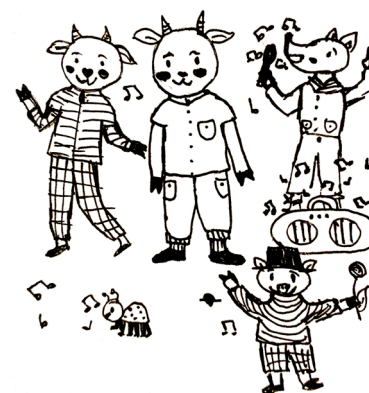
Рисунок Анны Иноземцевой