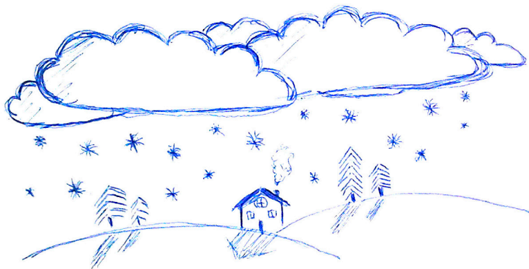
Рисунок Анны Иноземцевой

А снег опять летит в окно. Он точно сыплется из рая, И время вечно замирает: Ему застыть разрешено.