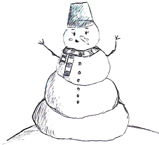
Рисунок Анны Иноземцевой

Я подарил снеговику Новую любовь: Слепил я снеговичку И красную морковь Я дал ей вместо носа, А рот — нарисовал. И вдруг “Какая милая!” Мой снеговик сказал. Но от неё он слышит В ответ: “Какой нахал!” Кажется, напрасно Он это вслух сказал. Заткнулся он, смутился И покраснел вдруг он, И сразу стало ясно, Что снеговик влюблён.